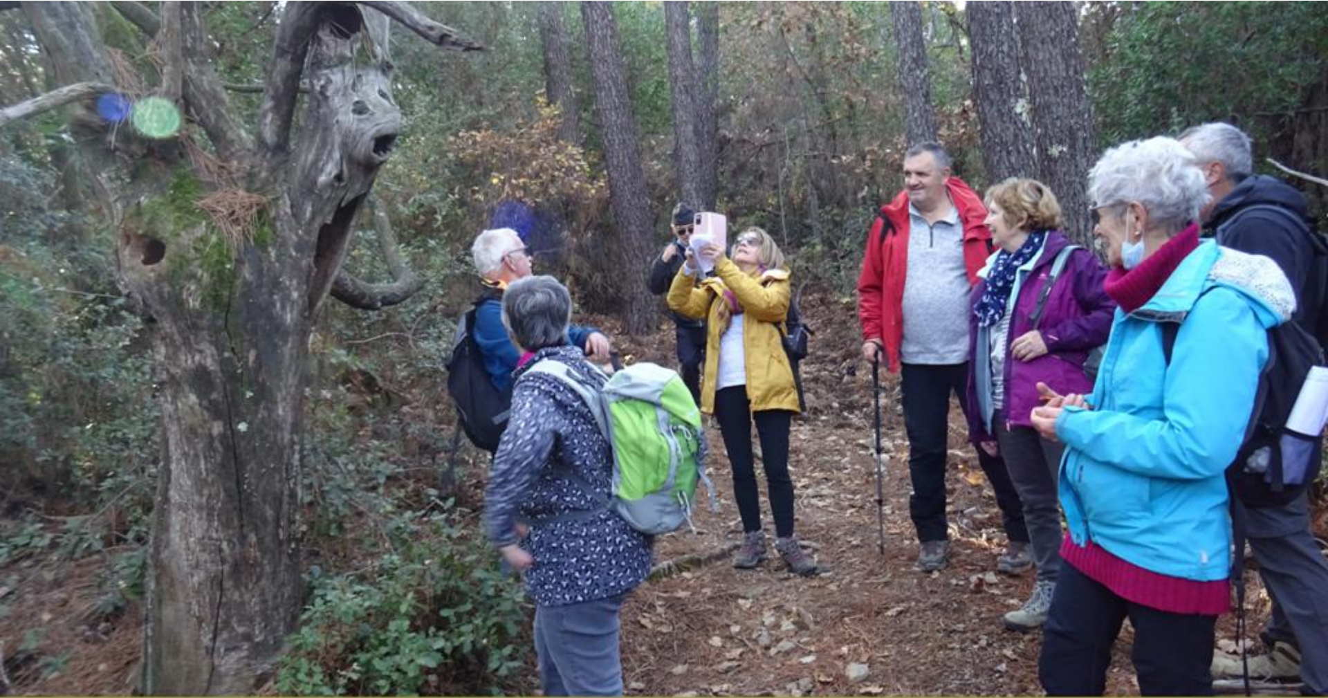
De pinèdes en chênaies une étrange rencontre...!!!! Kézaco????