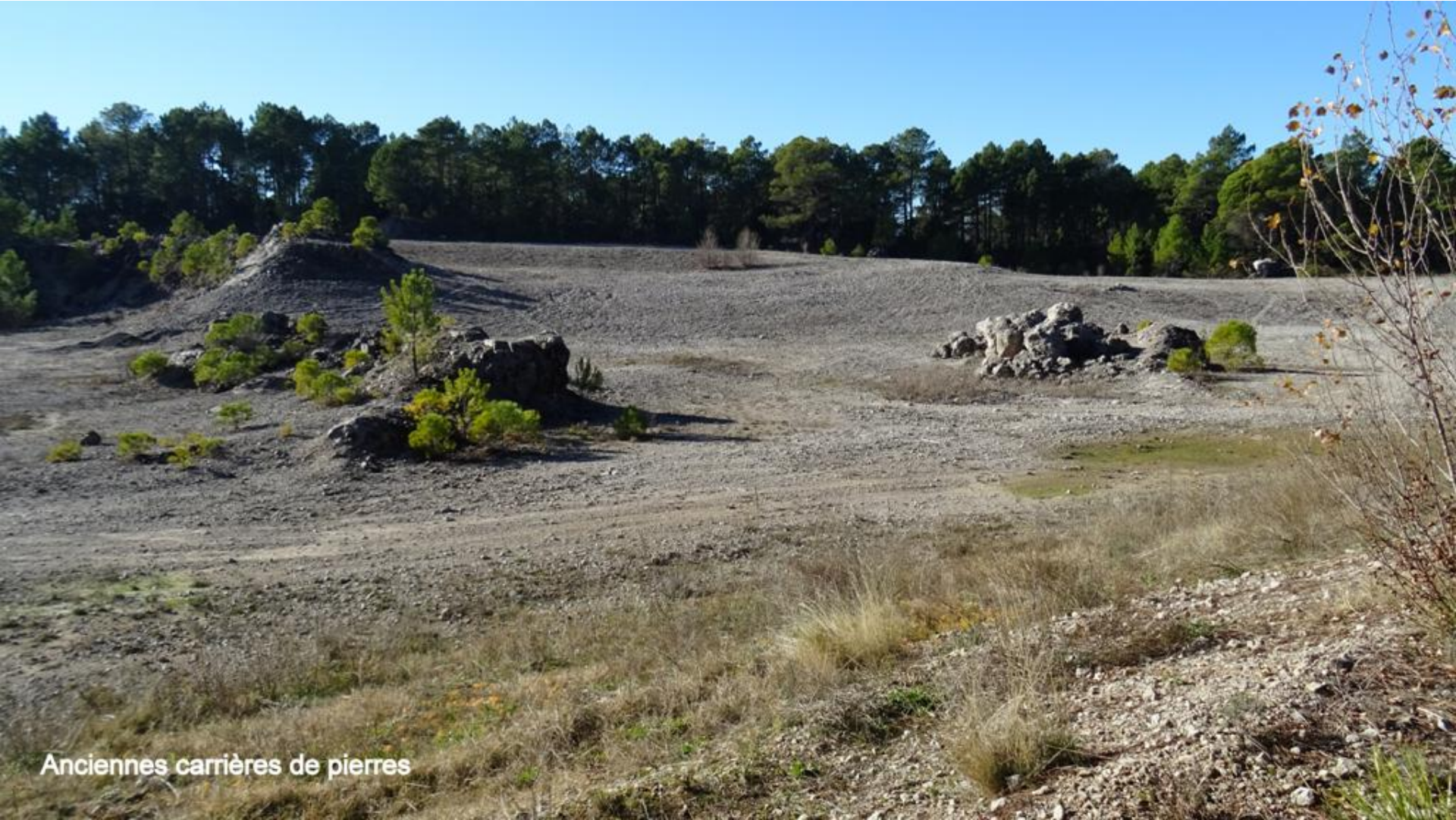
Anciennes carrières de pierres