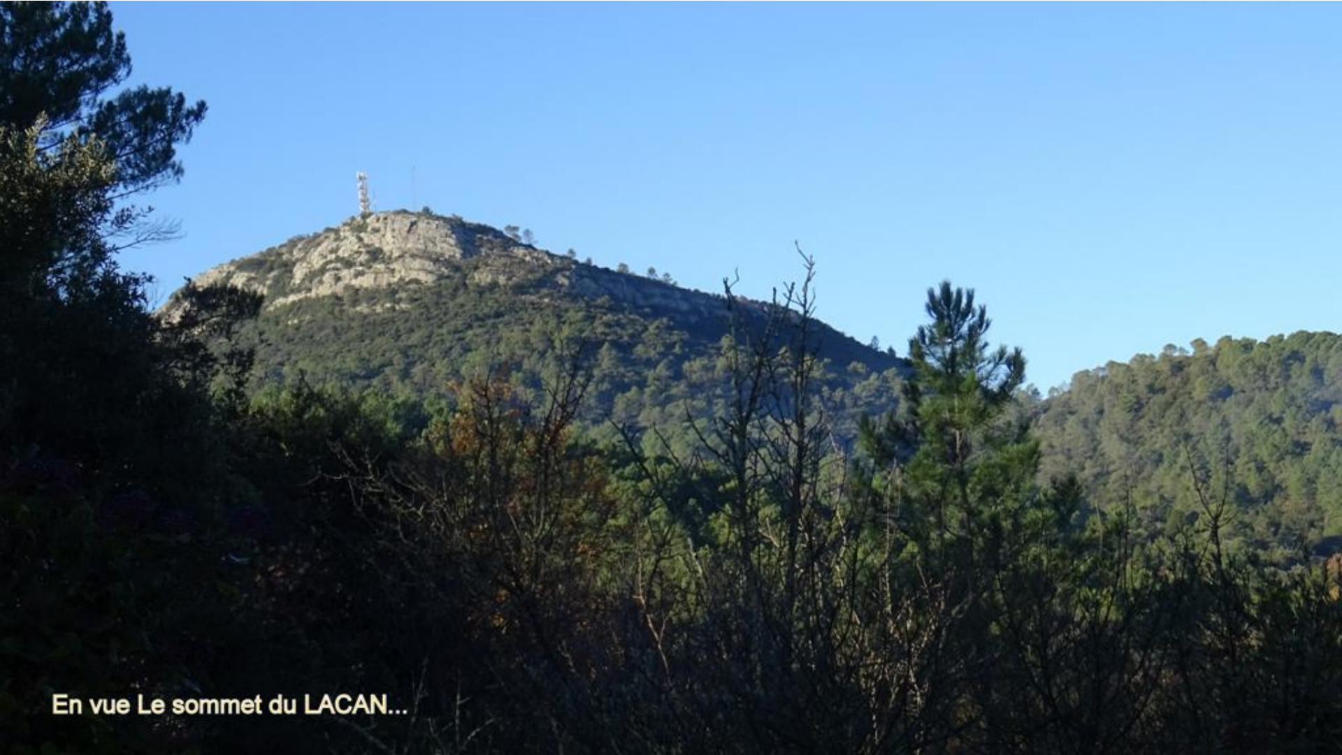
En vue Le sommet du LACAN...