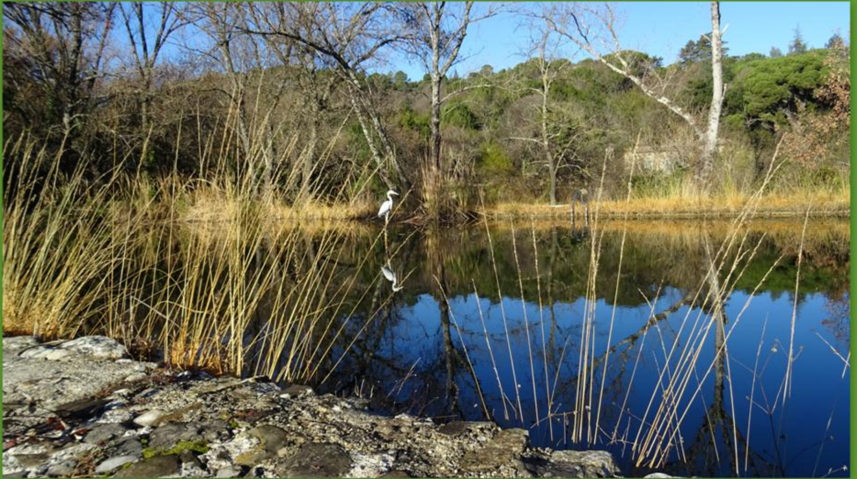
Une belle retenue d'eau dans laquelle un héron pêche indéfiniment