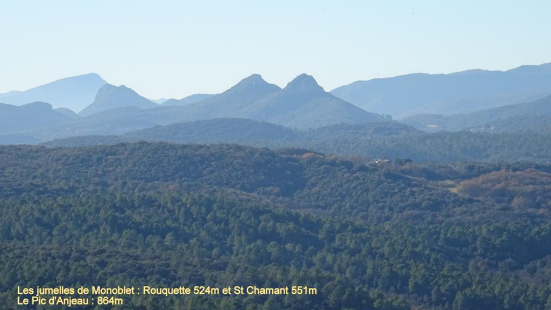
Les jumelles de Monoblet : Rouquette 524m et St Chamant 551m Le Pic d'Anjeau : 864m