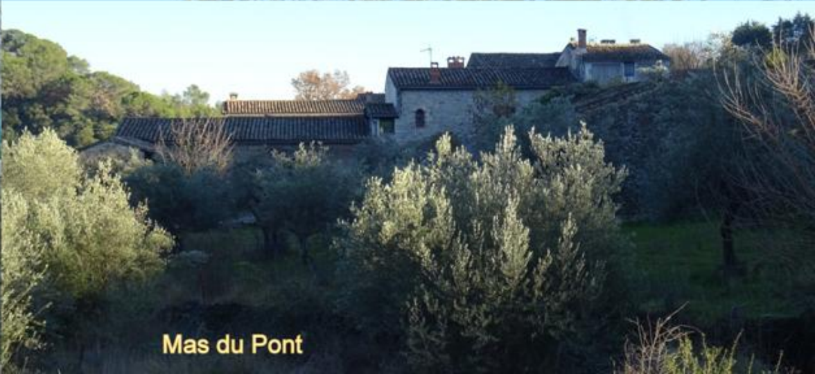
Mas du Pont