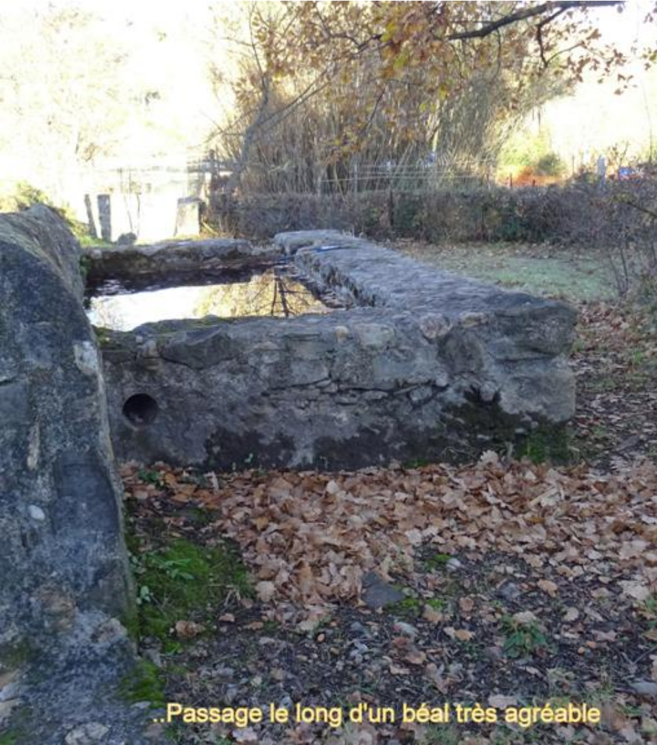
..Passage le long d'un béal très agréable