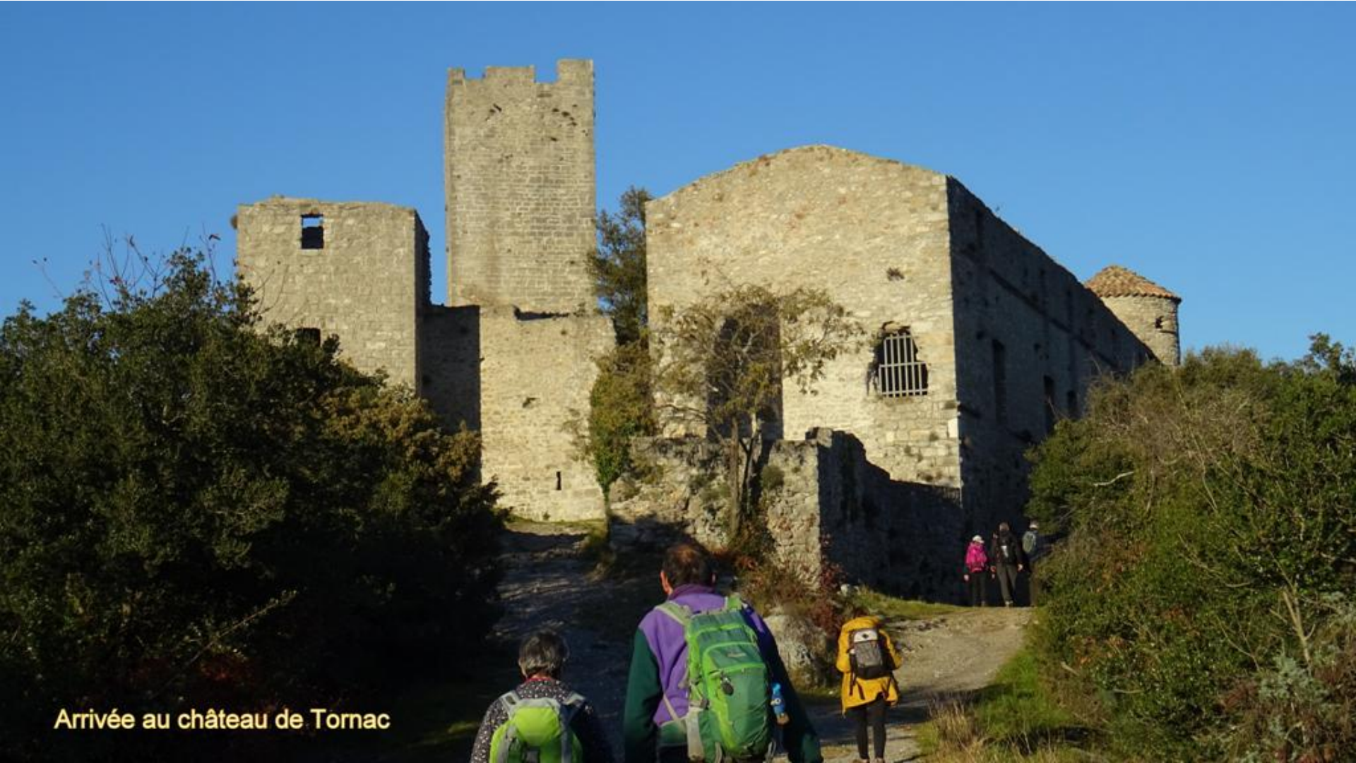
Arrivée au château de Tomac