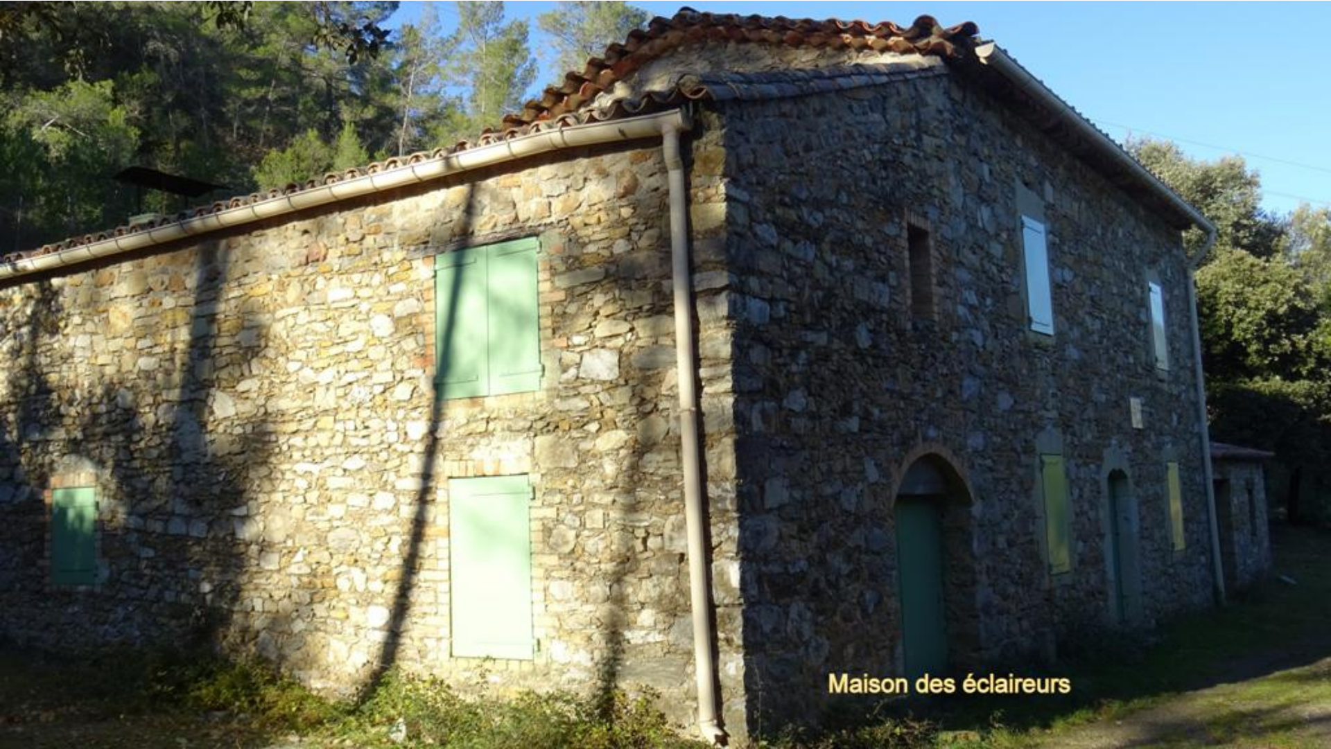
Maison des éclaireurs