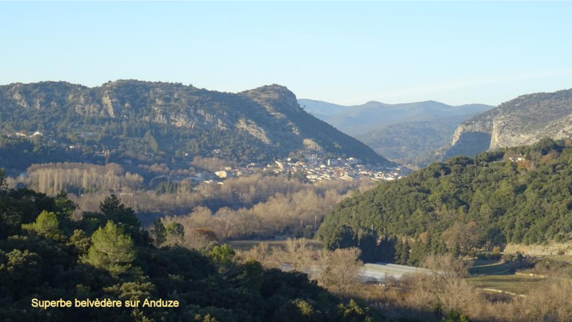
Superbe belvédère sur Anduze